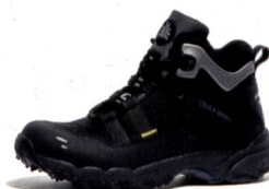
SPEED BUGrip® Active