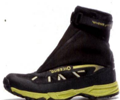
GG FLY BUGrip® Racing