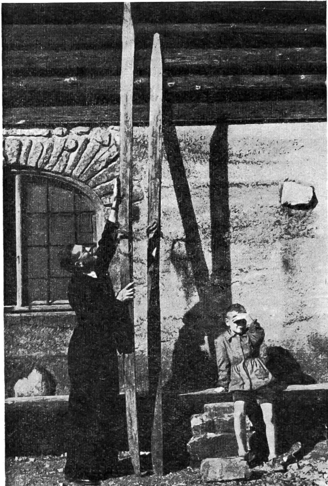
Le plus long ski du musée, 3 m. 67

A côté de ces skis géants, il y a encore un autre modèle de ski qui attire l'attention du visiteur. C'est un ski de grandeur normale dont la semelle est complètement recouverte d'une peau de phoque ou de renne. Intrigués, nous