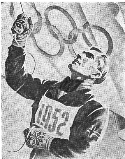
Les anneaux olympiques, symbole de l'étroite union des athlètes du monde entier

Lorsque les journalistes sportifs veulent donner à leurs lecteurs une image captivante d'un public tapageur ou d'un stade hurlant de protestation, ils choisissent de préférence le vocable « enfer ». Et pour quiconque se trouve mêlé à un tel « enfer », il est facile d'oublier qu'aux temps helléniques, les pistes de combat étaient les antichambres des temples et constituaient une partie de la vieille culture occidentale. On est à tel point fasciné par le spectacle qui se déroule sur la place de jeux ou sur la piste cendrée que l'on ne parvient que rarement à déchirer le voile qui masque les événements et à sentir le souffle de l'esprit du stade qui enflamme le champion au moment de la victoire et incite le vaincu à se donner jusqu'à la limite de ses forces. Mais il se peut alors que ce spectacle sportif devienne quelque chose de solennel qui touche le cœur de chacun de nous et engage au recueillement. Ce fut notamment le cas, par exemple, lorsqu'au moment de la clôture des Jeux olympiques de Londres, l'invitation fut adressée à la jeunesse du monde entier pour l'engager à se réunir, à nouveau, au bout de quatre ans à Helsinki. Dans le cœur de chacune des cent mille personnes présentes s'imprima, ineffaçable, l'image de la beauté, de la force, de la fraternité de cette jeunesse, mais aussi la question inquiétante et muette de savoir ce que lui réserveront — à elle et au monde entier — les années la séparant de cette prochaine rencontre !