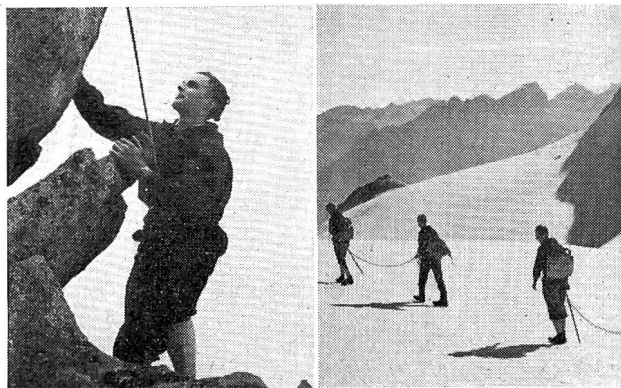
En montagne, tout paraît plus simple, plus riche! On se sent purifié!

L'alpinisme exige lui aussi une solide formation, mais une formation toute particulière qui s'étend sur plusieurs années. Un vétéran dirait même sur toute la vie! N'oublions jamais que la belle tâche qui nous a été confiée consiste précisément à conduire la jeunesse dans le merveilleux domaine des montagnes, afin d'enrichir ainsi sa vie et la nôtre.