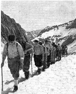
Premiers essais de marche sur un glacier

Comment pourrait-il différencier ce qui est jeu et ce qui est un problème sérieux, lui pour qui la vie est sans frontières ? Avec l'âme d'un enfant ne connaissant pas encore la mesure des choses, mais avec la force d'un homme capable de performances extraordinaires, il n'est pas rare qu'il franchisse cette limite qu'en montagne on ne peut voir mais seule-