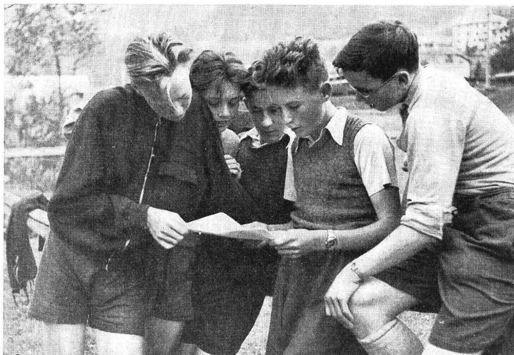
La course d'orientation, un sport jeune, passionnant !