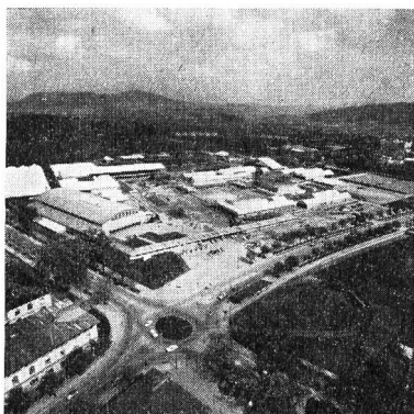
L'HYSPA, près de la place Guisan, occupe une superficie de 160000 m 2 . Les halles sont toutes sous toit.