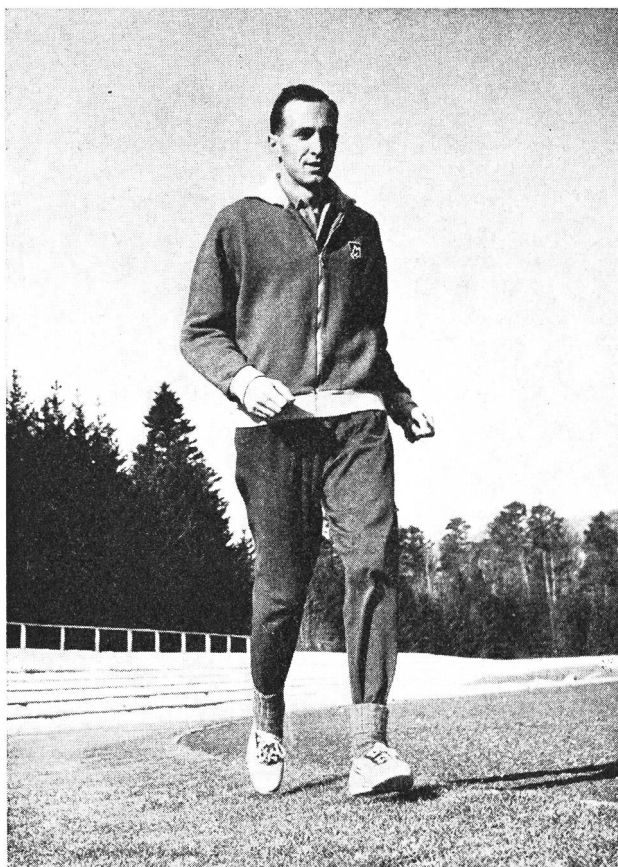
L'athlète s'entraîne librement sur la piste. Fixé à même la poitrine, sous son survêtement, l'émetteur ne gêne aucunement le coureur.

Les choses ont passablement évolué. Il va sans dire que la médecine sportive moderne continue à prévenir et à soigner les maux dont la manifestation ne peut jamais être tout à fait évitée lorsque le sport met fortement à contribution l'organisme et en raison des facteurs de danger inhérents au sport lui-même. D'autre part, il va de soi qu'elle s'attache toujours et dans une large mesure à prévenir les lésions en entourant le sportif des soins les plus judicieux, et cela non pas seulement avant une compétition, mais surtout en période intermédiaire. Il faudrait à ce propos veiller que