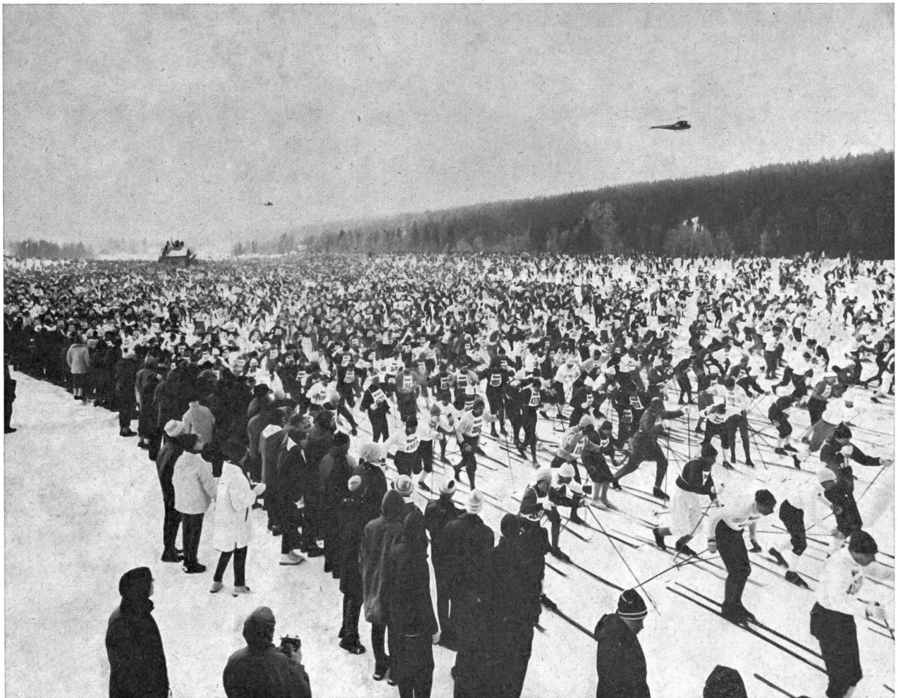
Départ de la course de Vasa (Suède). Verrons-nous un jour en Suisse semblable spectacle ?