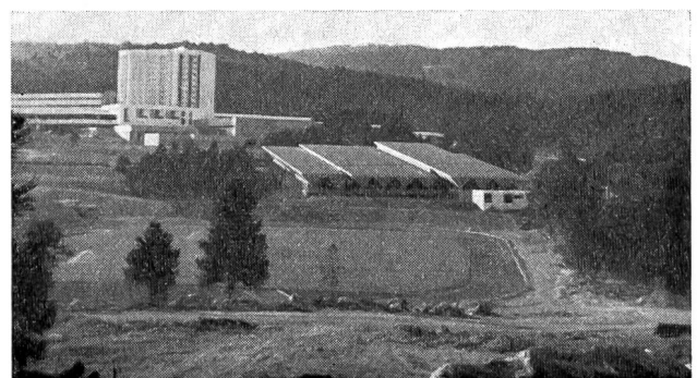
Le stade olympique, la patinoire couverte, le complexe central.

Les nations ayant reconnu l'acuité du problème, — Noël Tamini en a fait une excellente étude dans le No 8/1965 — de notre revue — il ne leur restait plus, dès lors, que de tenter, par tous les moyens, d'entraîner leurs athlètes dans des conditions aussi voisines que possible de celles de Mexico: les Américains, entre autres, aménagèrent, dans ce but, Red River (2300 m.), Colorado Springs, Albuquerque (1600 m.) et Alamosa (2400 m.); les Russes montèrent, pour leur part, à Bermamyt (2600 m.) et à Alma-Ata; la Suisse même découvrit St-Moritz, site magnifique auquel nous consacrerons une prochaine étude; la France enfin créa le Centre d'entraînement préolympique de Font-Romeu!