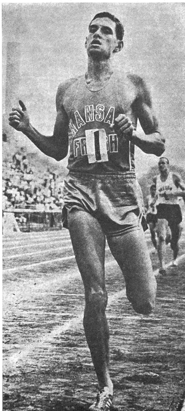
Jim Ryun: 3'33"1 sur 1500 m

Le 1500 m aussi bien que le mile représentent deux des distances les plus passionnantes de l'athlétisme. Avec le 800 m nous avons pénétré dans les premiers contreforts d'un pays mystérieux qui laissait présager l'existence de richesses particulièrement intéressantes. Nous sommes arrivés maintenant en plein cœur d'un monde nouveau dont le trésor est la résistance. Ici bien plus que sur 800 m encore, la vitesse et l'endurance ne suffisent plus à assurer le succès. Ces qualités doivent exister, certes, mais pour appuyer la résistance, cette sorte d'élasticité musculaire et de limpidité circulatoire qui assurent le maintien d'un rythme effort élevé grâce à une épuration rapide et parfaite du sang, polué par les déchets de combustion d'oxygène.