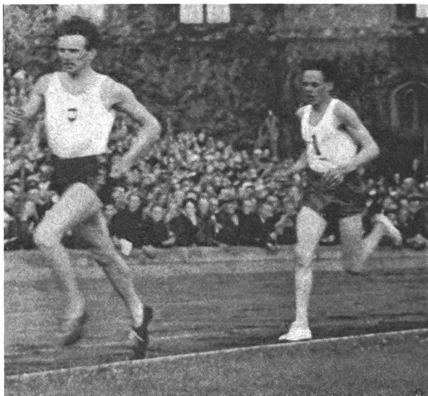
Les deux Suédois Arne Andersson et Gunder Hägg: toute une époque de l'athlétisme.

Bodo Tümmeler (Allemagne). La parfaite morphologie du coureur de 1500 m.