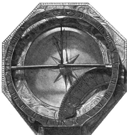
Boussole de voyage 1780 Musée des PTT Berne