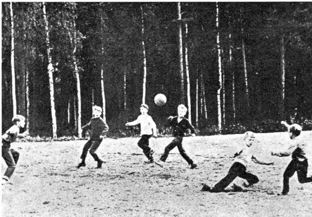
Le sport qui sauve...

Le sport est-il une fin ou un moyen ? Quels en sont les mobiles ? dans quelles mesures est-il bon, dans quelles mesures est-il mauvais ? Comment reconnaître en lui