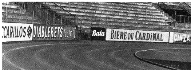
Le «stade», ce lieu saint où devrait se forger la santé et la joie de vivre, se prostitue à la publicité des tabacs et des apéritifs...