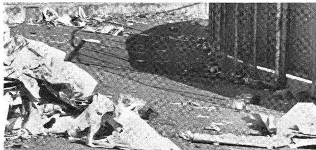
Le «stade», ce sanctuaire du sport, parsemé de cadavres après le match: ceux des bouteilles de bière...