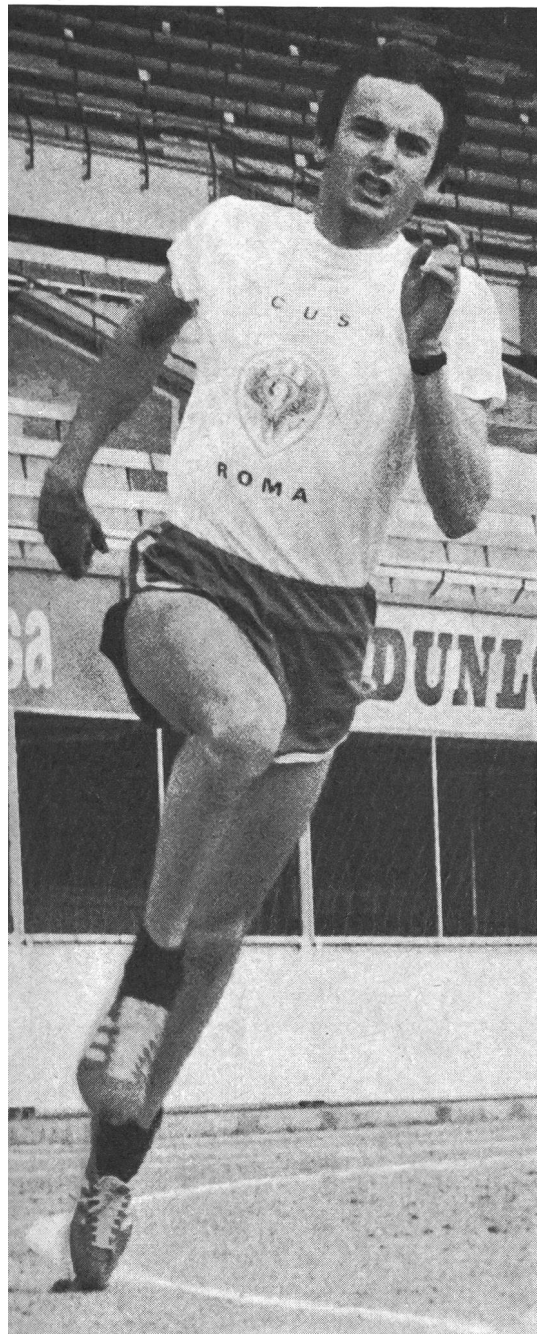
Vitesse du vent dans le décathlon et le pentathlon

On continuera à l'enregistrer afin d'apprécier la régularité des performances réalisées dans chaque épreuve individuelle.