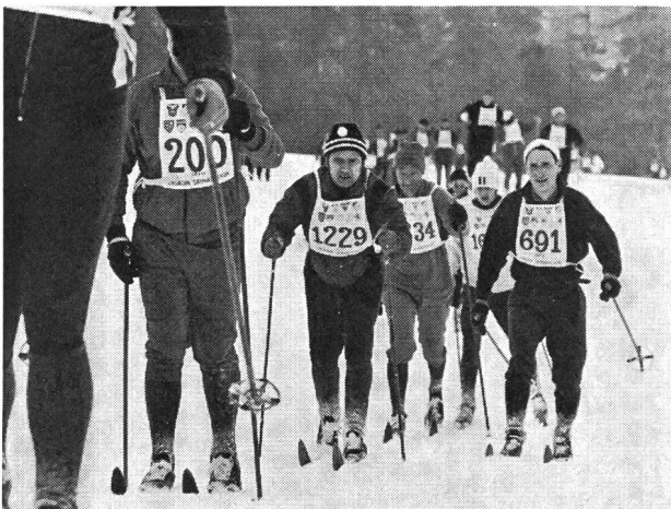
Ceux qui participent...