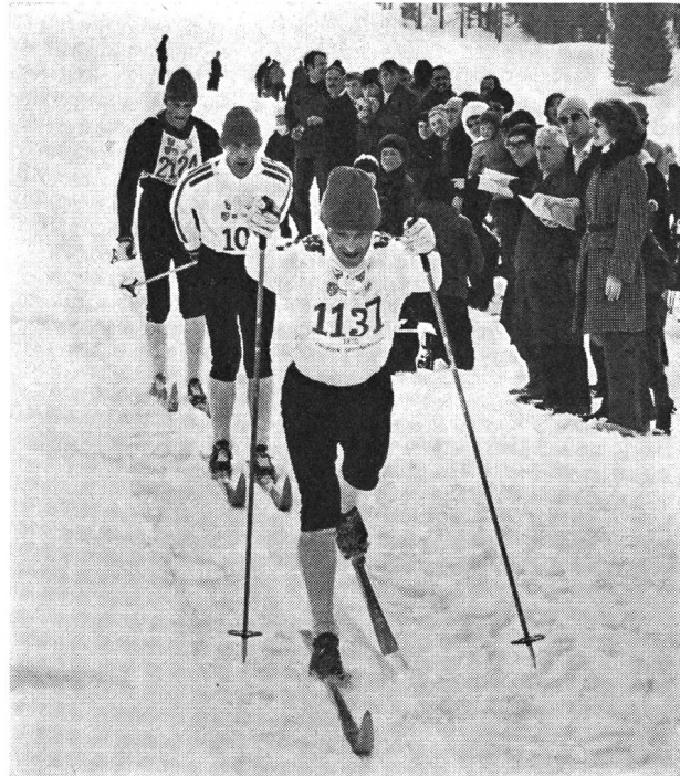
...et ceux qui luttent.

La composition de ce dernier repas sera adaptée à la fébrilité troublant le concurrent avant le départ. A ce moment-là, certains coureurs éprouvent un profond dégoût pour toute nourriture. Toutefois, comme cet ultime apport de calories peut être primordial par la suite, il faut s'efforcer de surmonter cette inappétence. Pour y parvenir, la meilleure solution est d'absorber un jus stimulant l'appétit (qui s'obtient sans ordonnance dans les pharmacies) 1 demi-heure avant le repas ou de boire un bouillon sans graisse ou évent. un peu de café noir. Il importe surtout de stimuler les glandes digestives. Si nécessaire, la digestion peut aussi être activée par la prise de tablettes d'enzymes (également en vente dans les pharmacies, sans ordonnance). Par ce moyen, on parvient aussi à assimiler des repas qui, en la circonstance, pourraient être