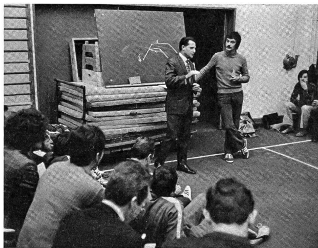
Quelques «échappées» malheureuses dans le domaine de la physiologie et de la médecine spécialisées...

«L'athlète qui s'entraîne durement doit pouvoir récupérer et surveiller sa nourriture. Il a un besoin particulier de vitamines et de calcium. La meilleure forme que je connaisse de ce produit, celle que prennent mes coureurs: calcium Sandoz!...»