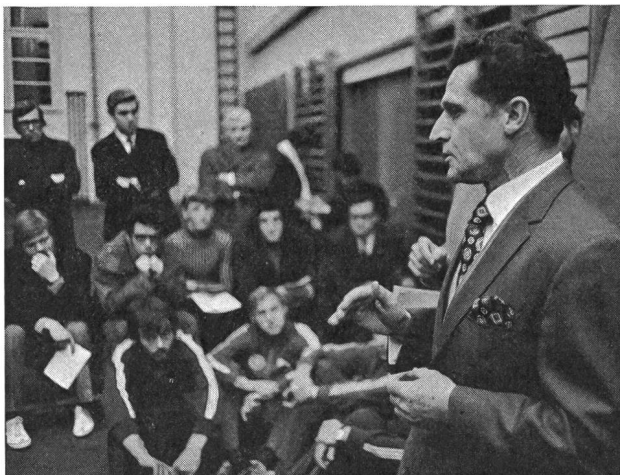
Gentleman énergique et conscient de sa réussite, Arthur Lydiard est resté jeune de corps et d'esprit, parce qu'il ne se contente pas de parler, il court encore...

Le 25 février dernier, Arthur Lydiard, un de ces monstres sacrés de l'athlétisme que l'on compare volontiers à des «sorcières», parce qu'ils parviennent à façonner des champions olympiques et des recordmen du monde selon des procédés inhabituels, était à Zurich.