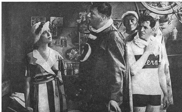
«Rivaux de la piste». L'entraîneur Wagnmuller interdit à Gina Stern (Suzet Maïs) l'entrée de la cabine de Willy (Albert Préjean).