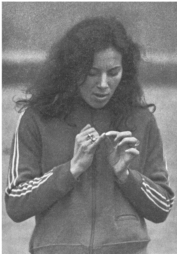
Pensive, Colette Besson me disait un jour...

ment disloqué? Tout ce que je suis en train d'écrire ressort, en fait, d'une éthique de vie dont la plupart des gens se moquent éperdument mais qu'il est bon de remettre, de temps à autre, en surface.