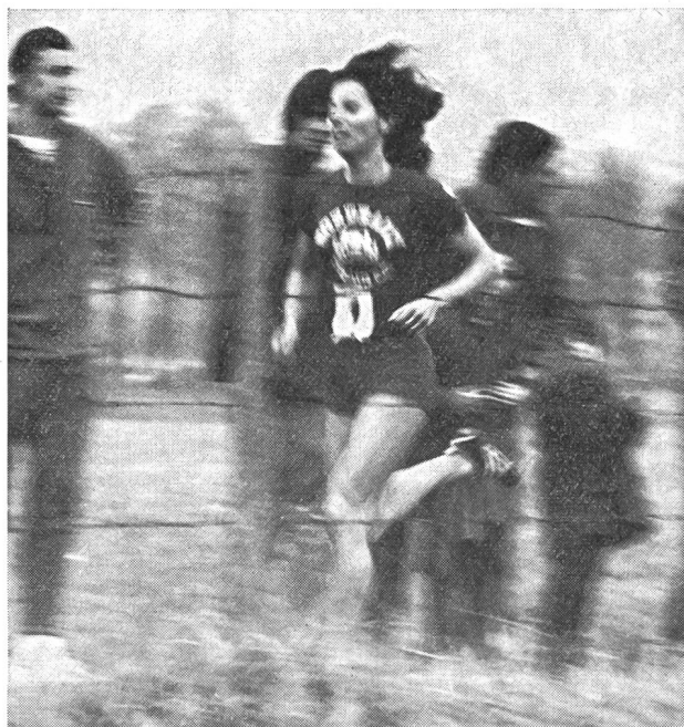
...«Je suis championne olympique du 400 m, mais je préfère les longues distances!...»