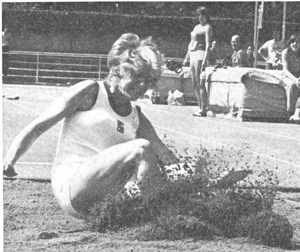
Il suffit d'une championne...

Le principal n'est-il pas de reconnaître le droit de tout un chacun au bonheur et à la santé? Mais le chemin des uns n'est pas nécessairement le chemin des autres. Ce qui compte, c'est le but à atteindre et la certitude d'y arriver. Le succès est une preuve de «justesse» et un cri de «justice!» Et je poursuivais en relevant l'aversion du public et des «spécialistes» pour l'athlétisme féminin, aversion motivée, il faut bien le reconnaître, par certaines «apparitions» peu flatteuses! »Dès lors, les filles athlètes, persévérantes et entêtées, devaient se munir plus que jamais d'un double courage avant de fouler la cendrée: celui qu'il faut pour débiter une «épreuve» et celui qu'il leur fallait pour affronter la foule hostile.