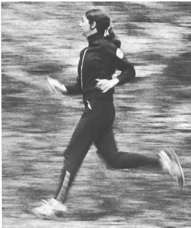
Kathy Switzer: «Quand je cours, je me sens vivre!»

Pour terminer ce paragraphe, j'aimerais citer un mot de Valéry: «Deux maux menacent le monde, écrit-il, l'ordre et le désordre. L'ordre parce qu'il endort les consciences et exclut le progrès: le désordre parce qu'il empêche toute décision et mine les espérances. Pour que la participation échappe à ce cercle vicieux, il faut l'organiser avec une même volonté d'aboutir.»