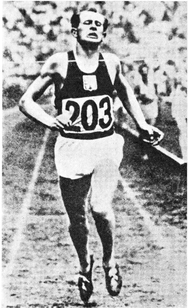
Zatopek, un de ces athlètes qui se sont «faits» seuls!