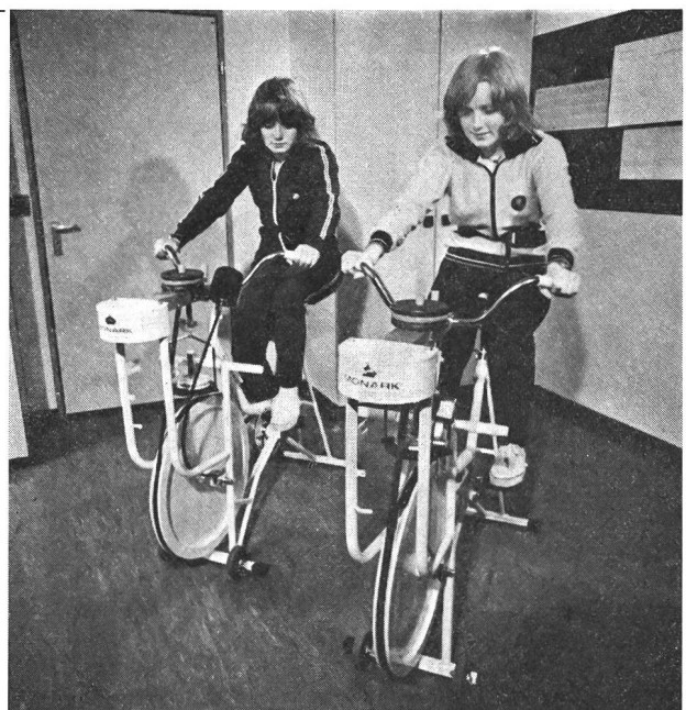
Fig. 2 Jumelles vraies sur la bicyclette ergométrique.