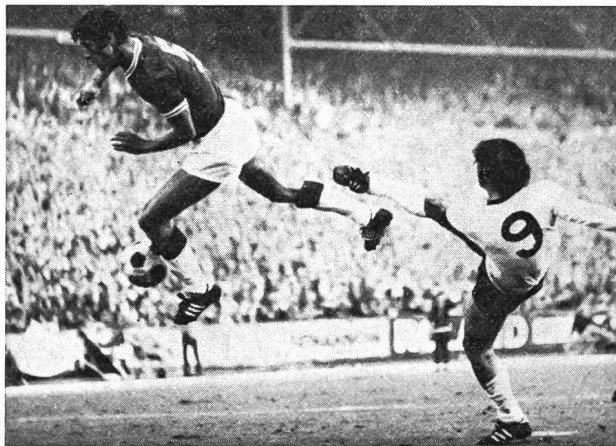
Allemagne - Turquie. Reprise directe en rotation de Gerd Müller.

Lors des dribbles, du coup de tête, de la remise en jeu, du tir en rotation (cf. photo de G. Müller) ainsi que lors de la passe et du tir de façon générale, la force du torse est à la base d'une exécution correcte et puissante du mouvement. La force de la musculature du torse joue un grand rôle dans la condition physique lors des courses, des sauts, des changements de direction et des feintes de corps.