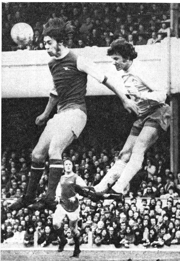
Duel de la tête lors d'un match du championnat anglais: Arsenal - Derby County.

Le travail musculaire et par conséquent la force est à la base de toute activité physique. La bonne exécution d'un mouvement ou d'une suite de différents mouvements dépend en partie de la force disponible. Ce facteur force représente une des bases essentielles de la qualité des différents mouvements propres au football. La force proverbiale du football anglais, dont dépend par exemple la bonne qualité du jeu de tête (cf. photo) ou des longues passes, est concevable en Angleterre parce que la force est entraînée systématiquement chez les jeunes footballeurs.