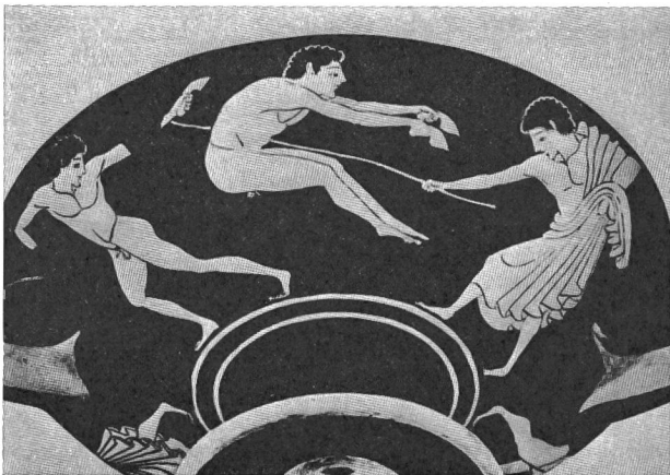
Exercice de saut chez les Grecs.