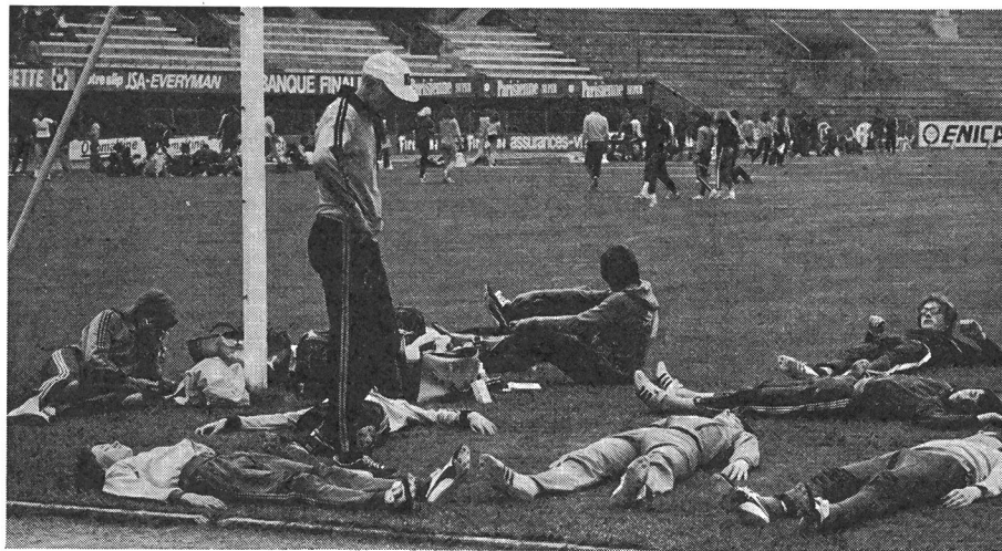
Un trait fort sympathique des journées du sport scolaire est le travail d'équipe. Chaque moniteur prépare soigneusement ses protégés à la compétition, ici par des exercices de décontraction alternés avec des tests de réaction.

Les jeunes athlètes ne se soucient guère des tribunes vides du «Stade Olympique». Ils n'avaient pas besoin d'une grande coulisse pour leur motivation. Ils débordaient d'énergie comme le témoigne cette série du 80 m.