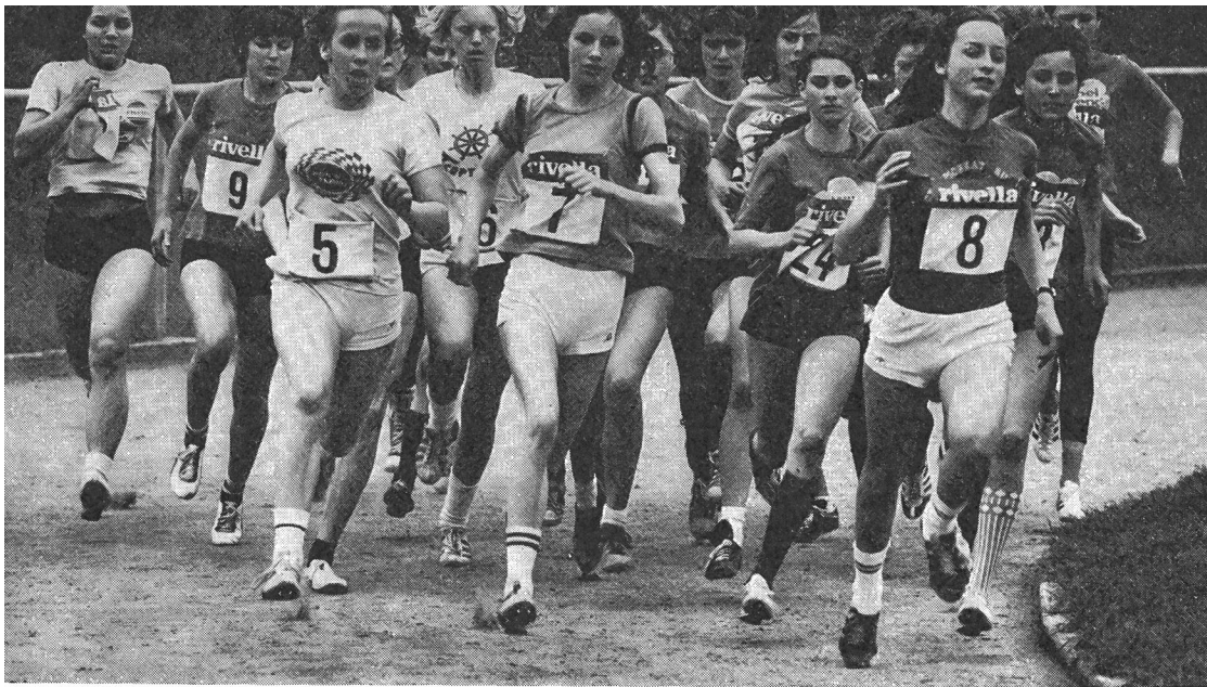
Décidées à tout, les jeunes filles se lancent sur les 1000 mètres. Un exemple de courage et de volonté à imiter.