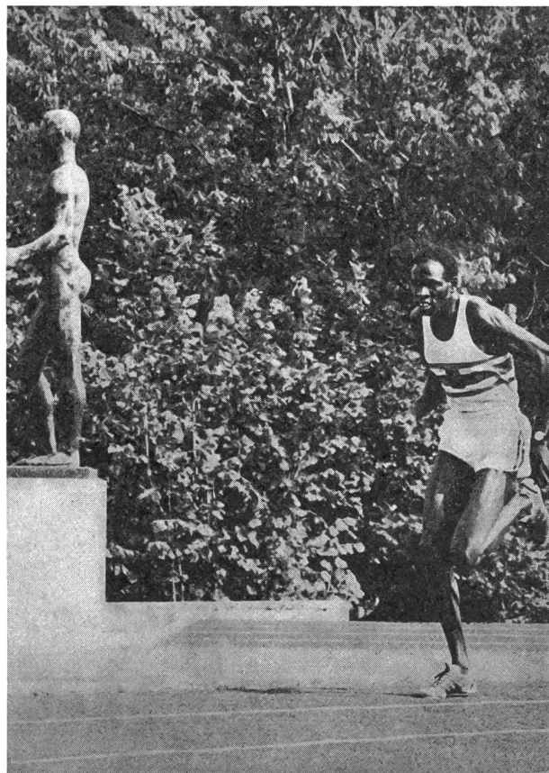
Mike Boit: il a su passer le cap de la jeunesse en forgeant son corps et sa volonté. Maintenant seulement, le record le préoccupe quelquefois.

«Nous fûmes autrefois des guerriers valeureux.» Les hommes dans la force de l'âge répondaient: «Nous le sommes; faites-en l'épreuve, si vous voulez.» Et le chœur des éphèbes se vantait en disant: «Un jour nous serons bien supérieurs encore.»