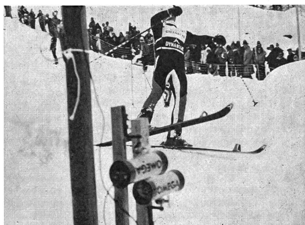
Une arrivée de slalom parallèle — Omega donne la mesure de sa technologie de pointe: grâce à ces cellules électroniques d'exécution spéciale, on obtient sans aucun risque d'erreurs, une précision absolue, même dans le cas d'une arrivée critique, telle que celle-ci.