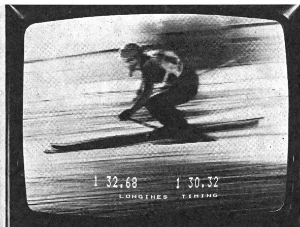
Chronométrage et information télévisée — La performance chronométrée est intégrée à l'événement grâce aux générateurs de symboles numériques développés par les techniciens de Swiss Timing.