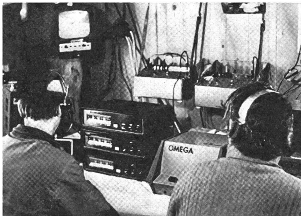
Cette photo montre une facette du chronométrage Omega en pleine action; la télévision est raccordée on line et retransmet en direct.

nement utile en 1976 mais, comme on vient de le voir, les méthodes de travail ont considérablement évolué depuis lors. Le recours systématique aux procédés électroniques, les nécessités d'un traitement rapide de l'information et la retransmission d'un certain nombre de données en direct à la télévision ont modifié les conditions dans lesquelles s'effectuera le chronométrage des Jeux olympiques d'hiver 1976. Swiss Timing et les maisons Omega et Longines s'y sont préparées en chronométrant au cours de ces derniers hivers un nombre imposant de manifestations sportives (Championnats ou Coupe du Monde de Ski, Championnats du Monde ou épreuves internationales de bob, de luge, de patinage de vitesse, etc.).