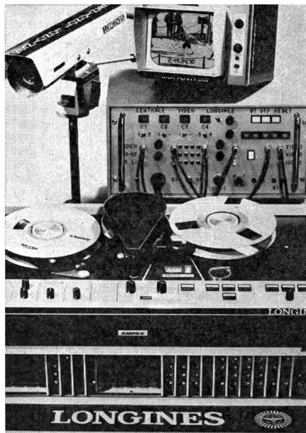
Complexe Vidéo-Longines: enregistrement électronique des images d'arrivées à raison de 100 images à la seconde, soit une image chaque \frac{1}{100} de seconde. Cette installation sera engagée par Swiss Timing dans le contrôle d'arrivées des épreuves par équipes en ski nordique.

L'appareil utilisé par Swiss Timing offre la possibilité de mémoriser et de restituer les temps de 120 concurrents en piste en même temps, quel que soit l'endroit ou l'instant de l'épreuve. Comme au ski alpin, les départs sont enregistrés par la poussée du portillon de départ, les arrivées et les temps intermédiaires éventuels par des cellules photo-électriques.