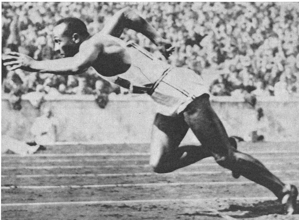
Le grand Jesse Owens: des trous dans la cendrée.

Déjà sont apparues des pointes spéciales pour le Tartan, véritables cardes — ou chardons — qui sont homologuées. Et ce n'est que justice!