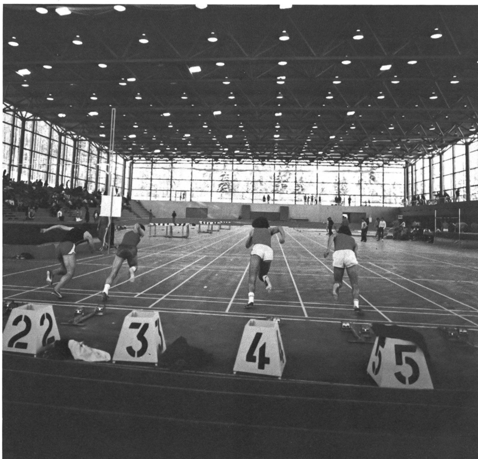
La grande salle omnisports à Macolin

Mais c'est justement parce qu'ils savent monter des spectacles attrayants, même s'ils sont hybrides, que les «Yankees» remplissent leurs salles. Les puristes frémissent à l'idée qu'un acrobate de cirque puisse exécuter ses tours entre un saut à la perche à 5,50 m – acrobatie de performance – et le départ d'un 60 yards. Mais n'est-ce pas le moyen le plus sûr de faire découvrir à la masse ignorante quelque chose qui va peut-être la passionner par la suite? Qu'on le veuille ou non, dès que l'athlétisme se donne un toit et quatre murs, il devient essentiellement spectacle, ce qui est vrai aussi, mais à un degré moindre, au stade; ce qui peut, par contre, ne pas être du tout le cas en pleine nature.