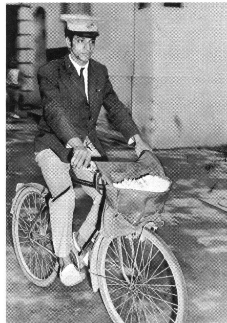
La course traditionnelle des télégraphistes organisée par l'ANSCT.

ron 10000 fr.) pour les activités internationales de l'Association dans le cas où elle organiserait des compétitions à l'occasion d'une fête nationale ou autre. Grâce à l'abnégation, à l'enthousiasme d'une poignée d'hommes et à l'esprit d'innovation dont ils ont fait preuve, nous avons pu développer l'ANSCT par nos propres moyens, tout en réduisant les frais administratifs. Nous espérons, et nous en sommes convaincus, que le soutien du Ministère des affaires sociales nous permettra de surmonter les difficultés financières qui pourraient entraver un meilleur développement de l'Association. Relevons également que le Ministère de la Jeunesse et des Sports a fourni un directeur national technique pour l'éducation physique utilitaire et professionnelle et un directeur national technique pour l'activité socio-éducative.