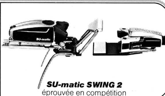
SU-matic SWING 2 éprouvée en compétition