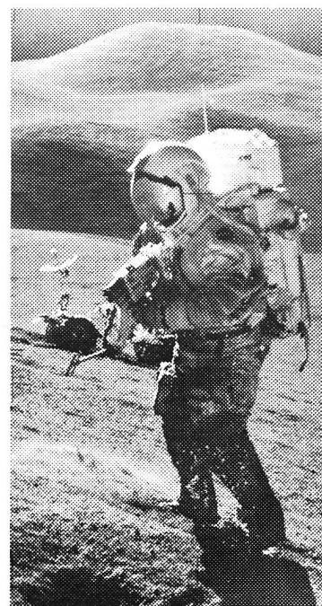
145 0022 - Seamaster, Speedmaster professional, remontage manuel, étanche.