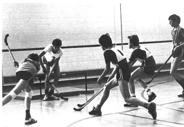
Transformable en but de hockey