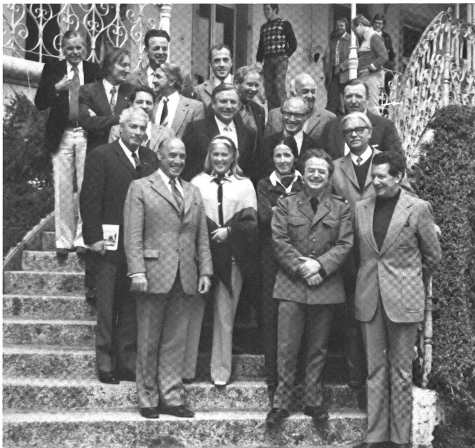
Commission plénière des années 1973 à 1976.