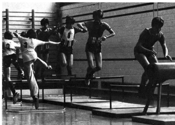
Entraînement de détente