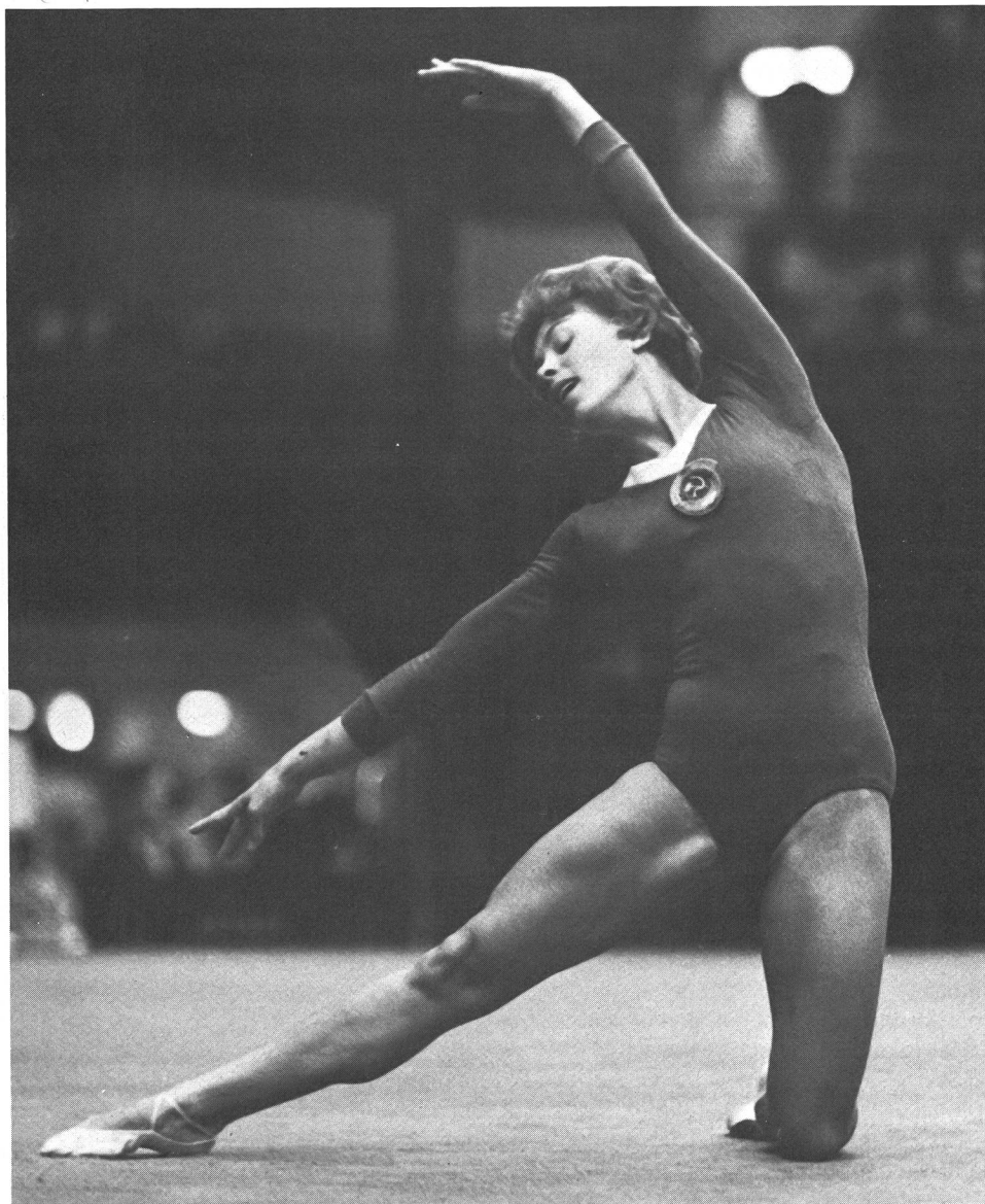
Larissa Latynina (Championnat du monde de Prague 1962)

Larissa Latynina (la Belusova de la gymnastique), Vera Caslavskaja (la fille toujours en or), Natalia Kutchinskaja (la joie de vivre), Zinaïda Drouginina (reine de beauté), Olga Karasseva (la blonde de miel), Larissa Petrik (vive panthère), Angelika Hellmann (les yeux de Marlène), Elvira Saadi (vraie circassienne), Ludmilla Turicheva (la classe par excellence), Nelly Kim (le sourire pétillant)... je les ai toutes vues, je les ai toutes admirées depuis trente ans que je brouillonne de compétitions internationales en compétitions internationales de gymnastique.