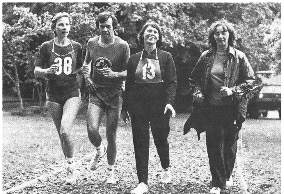
La piste finlandaise: une installation sportive «pour tous».

Les installations de sport qui constituent un élément essentiel de l'infrastructure doivent être intégrées dans l'aménagement du territoire. Autrement, les intérêts sportifs risquent de ne pas être du tout considérés ou de ne l'être que partiellement en raison des structures spatiales pré-