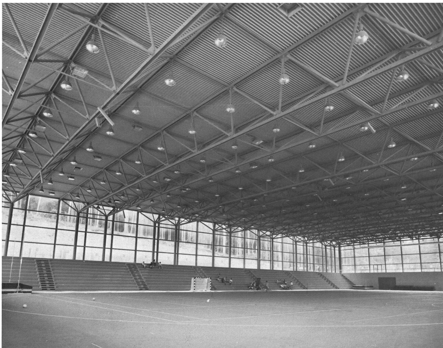
La part de l'architecture dans les installations de sport.

La réalisation d'installations sportives implique de tenir compte des aspects résultant de la fonction centrale de l'exercice du sport au sens le plus large. Dans le domaine de l'architecture et du sport, les contraintes d'ordre fonctionnel, technique et de projection sont multiples. A cet égard, il ne faut pas seulement envisager une installation en tant que telle, mais aussi sa situation et son intégration dans un contexte local ou régional. En partant d'exigences généralement réglementées, il convient dès lors de concevoir des solutions fonctionnelles et pratiques qui tiennent compte des besoins des divers groupes d'utilisateurs. ■