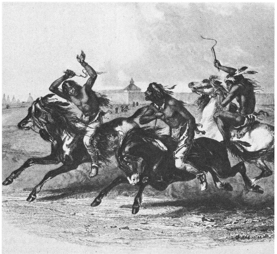
Course de chevaux chez les Sioux (Carl Bodmer)