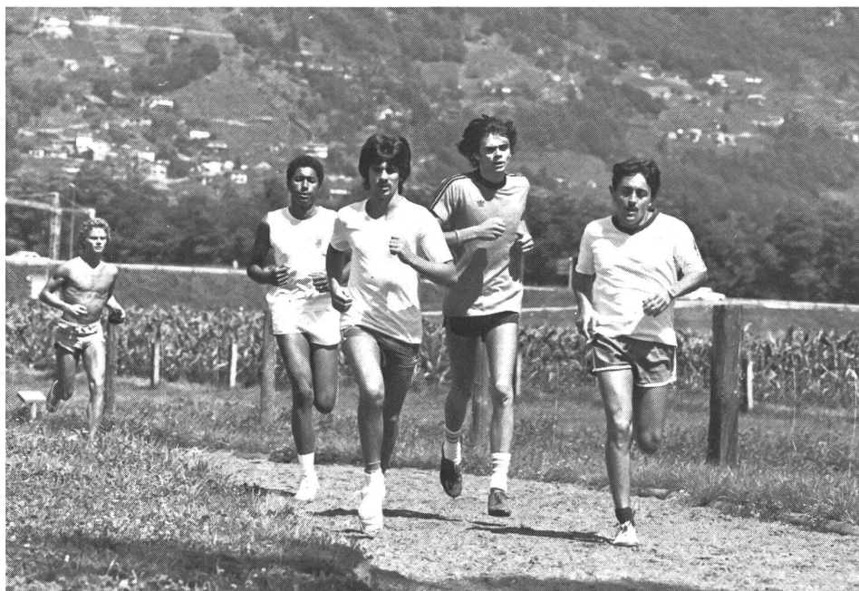
Tenero: une magnifique piste finlandaise.