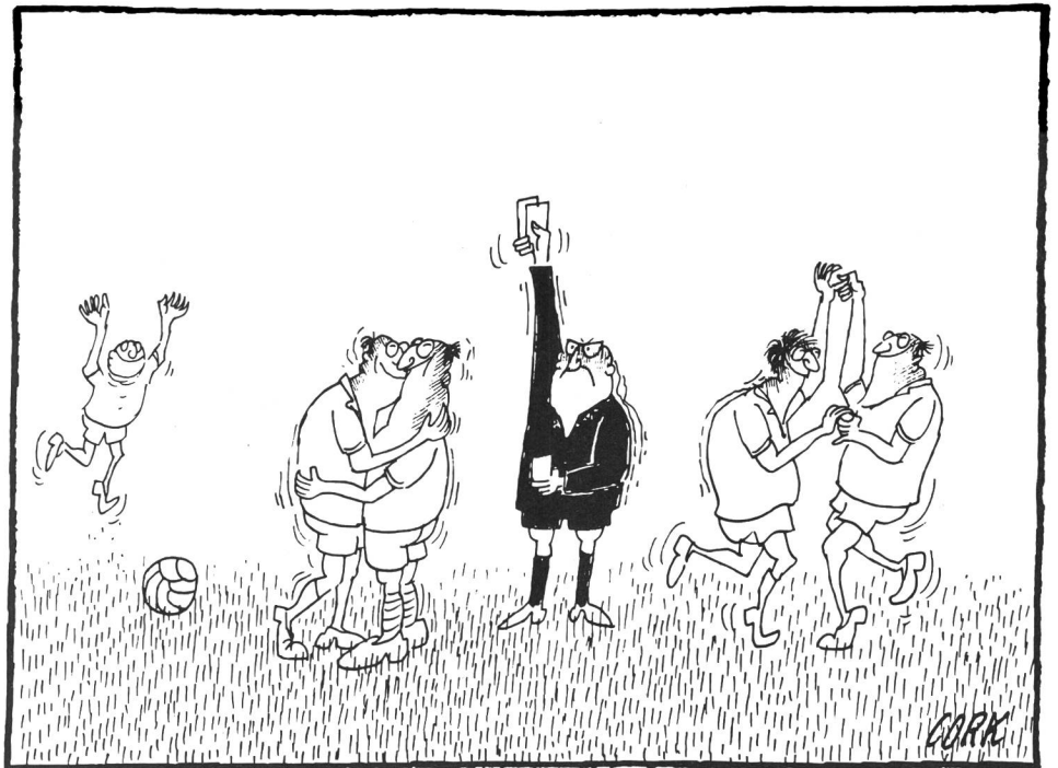
Soyons fair play mais... restons sportifs!