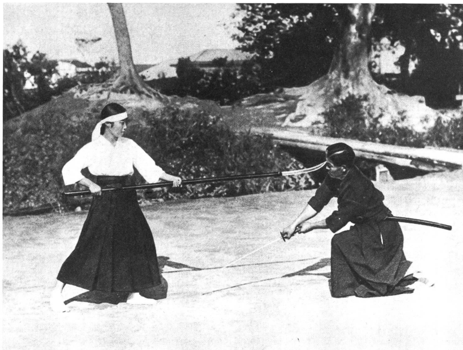
Enseignement du combat à la naginata au Japon (1932)