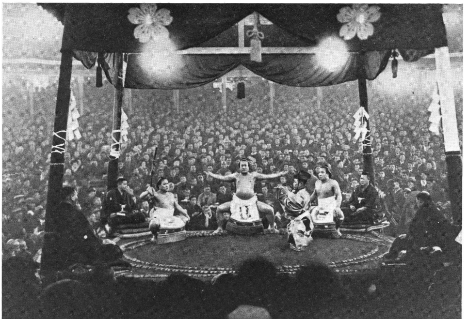
Ouverture d'un combat de Sumo

Dérivé du Jiu-Jitsu, technique d'autodéfense sans armes, le Judo, la méthode douce, est un sport de combat plus connu en Europe que le Sumo. Par la mise à profit des dix unités de force de l'adversaire, il est possible de le mettre hors de combat bien qu'on ne possède soi-même que sept de ces unités. Seule l'agilité compte. Grâce à l'élaboration de quelques règles, le professeur Jigoro Kano (1860–1938) est parvenu à faire d'une dangereuse méthode d'autodéfense, un sport de compétition presque inoffensif.