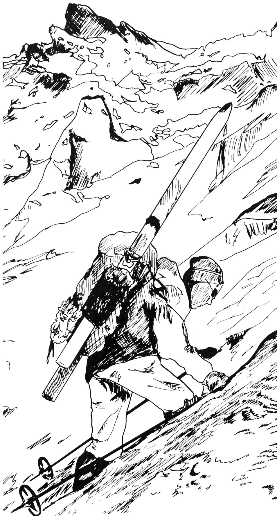
Illustration tirée de «Ski de randonnée» par A. Bartholomé