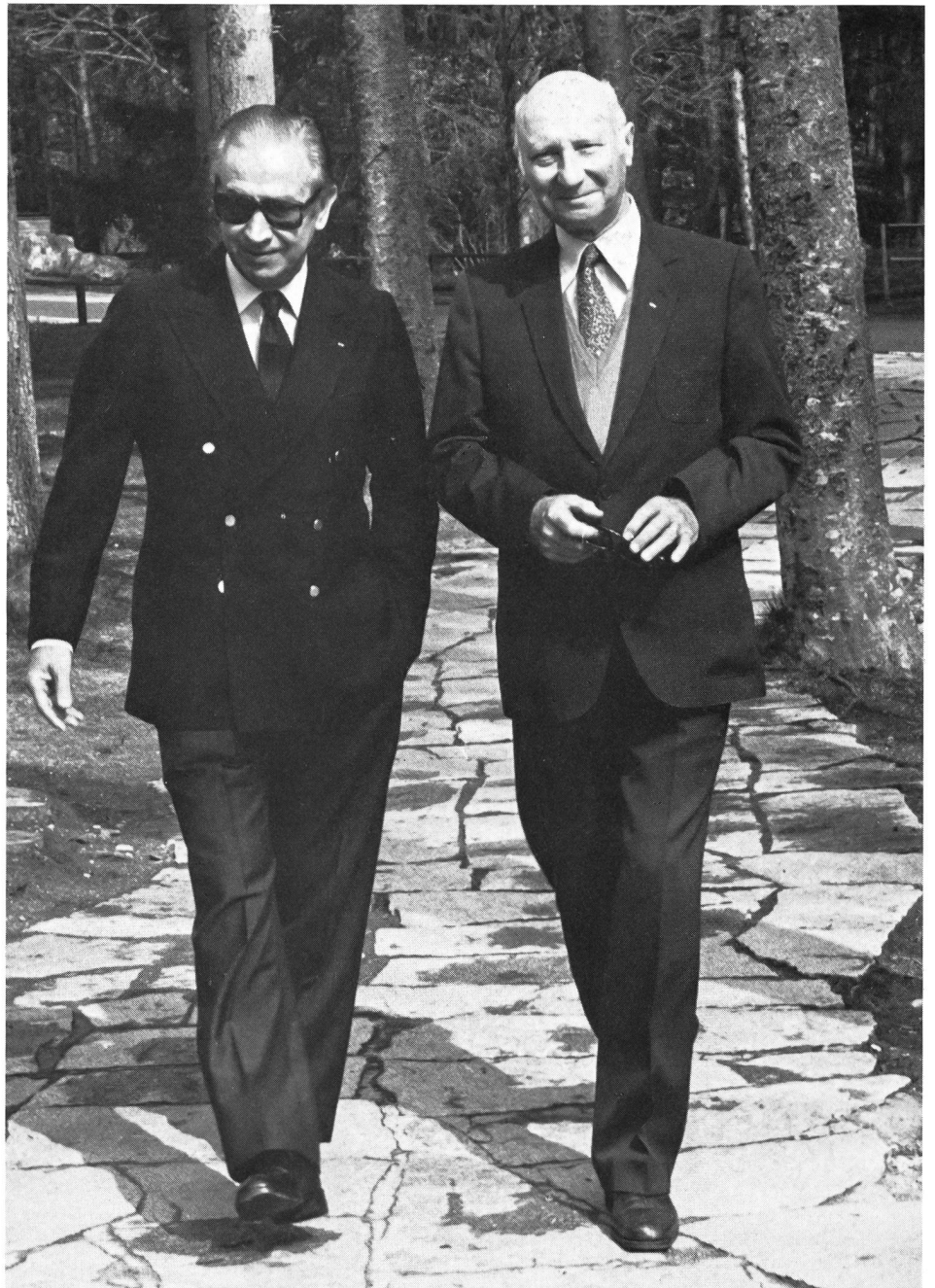
Avec M. Samaranch, s'écrie M. Gafner (à droite), l'olympisme descend dans la rue!

Par notre résolution, nous lançons un vibrant appel à la solidarité dans l'accomplissement, par les hommes et par les femmes à égalité de droits, du mode d'expression le plus simple, le plus universel et le plus efficace qui puisse s'imaginer, mis à la disposition de l'être humain pour le maintien et le développement de sa santé, de son bien-être et de son équilibre général. Très rapidement un esprit, dit «esprit Spiridon» s'est emparé du mouvement en pleine expansion. Les principes dont il s'inspirait boule-