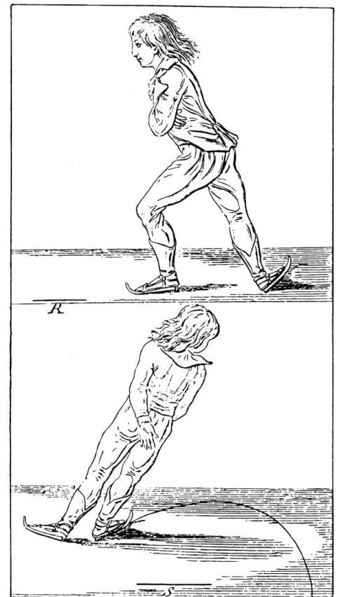
Les origines du patinage en Suisse.

Les réponses exactes qui parviendront à la: Rédaction française de la revue «Macolin», EFGS, 2532 Macolin, jusqu'au 27 octobre 1983 dernier délai, prendront part à un tirage au sort (les employés de l'EFGS et leurs familles en sont exclus). Un prix récompensera l'heureux gagnant. N'oubliez pas d'indiquer vos nom et adresse.