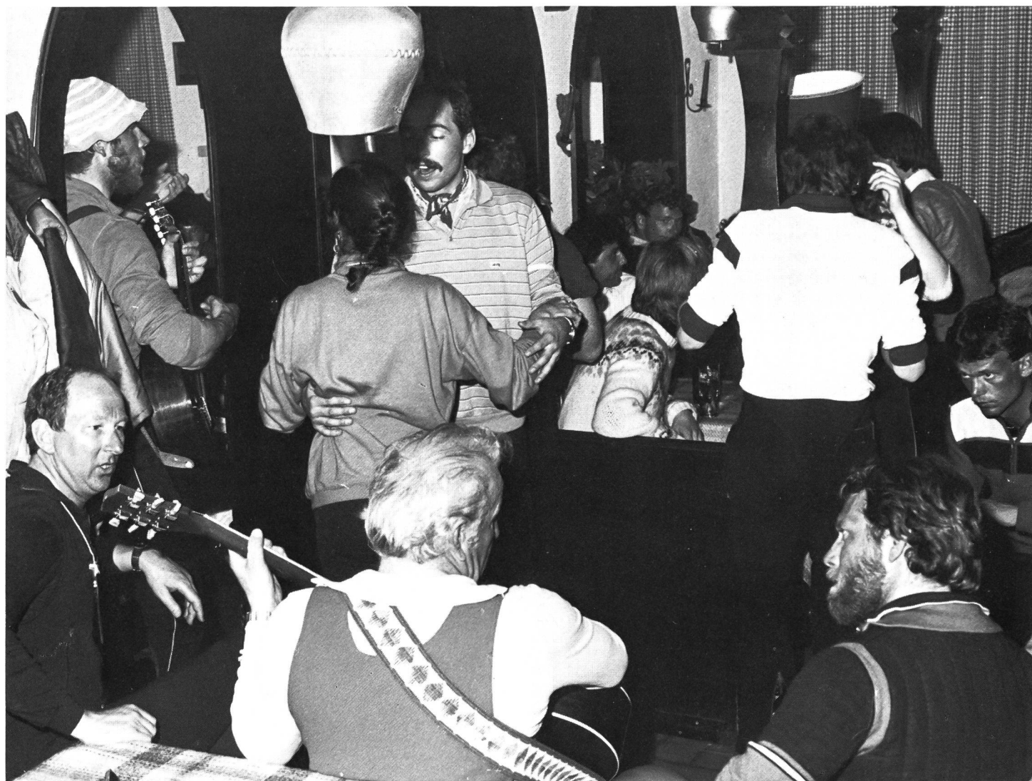
... avant de se délasser un brin.