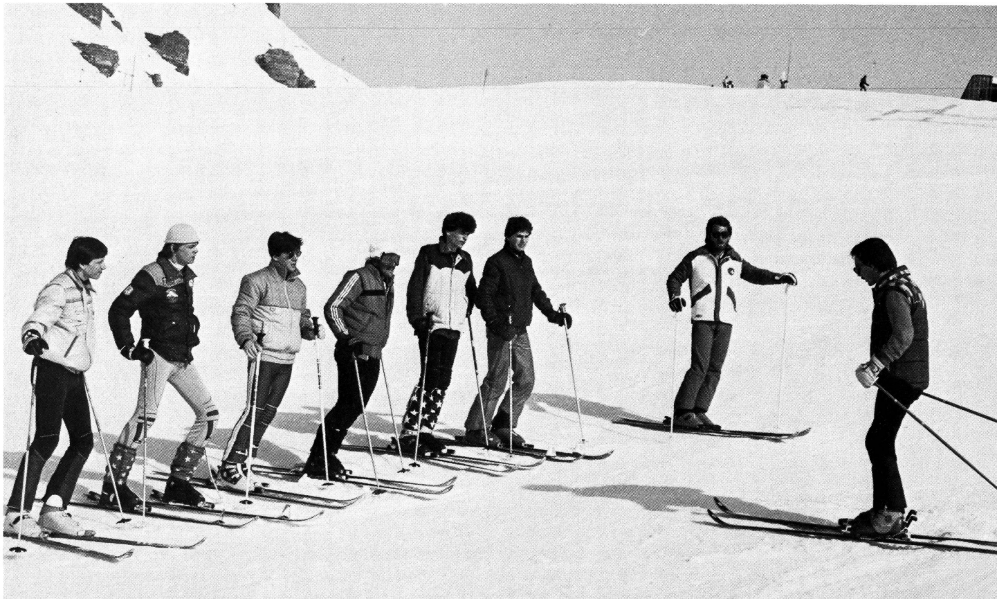
La théorie avant la pratique.

En fait, lors de telles réunions de formation, les enseignants doivent s'efforcer d'apporter – et les candidats moniteurs de recevoir – les éléments fondamentaux, d'ordre aussi bien socio-pédagogique que pratique, qui correspondent à ceux prônés par la « Conception Jeunesse + Sport » et qui sont, pour les premiers, de ne pas oublier qu'ils ont à préparer des meneurs d'hommes (les seconds) capables non seulement d'encadrer, mais d'animer, d'enthousiasmer une jeunesse qui, à l'âge qu'elle a, n'attend qu'un signe de motivation suffisamment convaincant pour se laisser entraîner dans le sillage d'un chef de file. « Le dynamisme de J + S dépend de l'esprit et des qualités de ses moniteurs. » Or, les qualités se cultivent pour mieux éclore et l'esprit s'acquiert et se développe pour mieux se répandre. ■