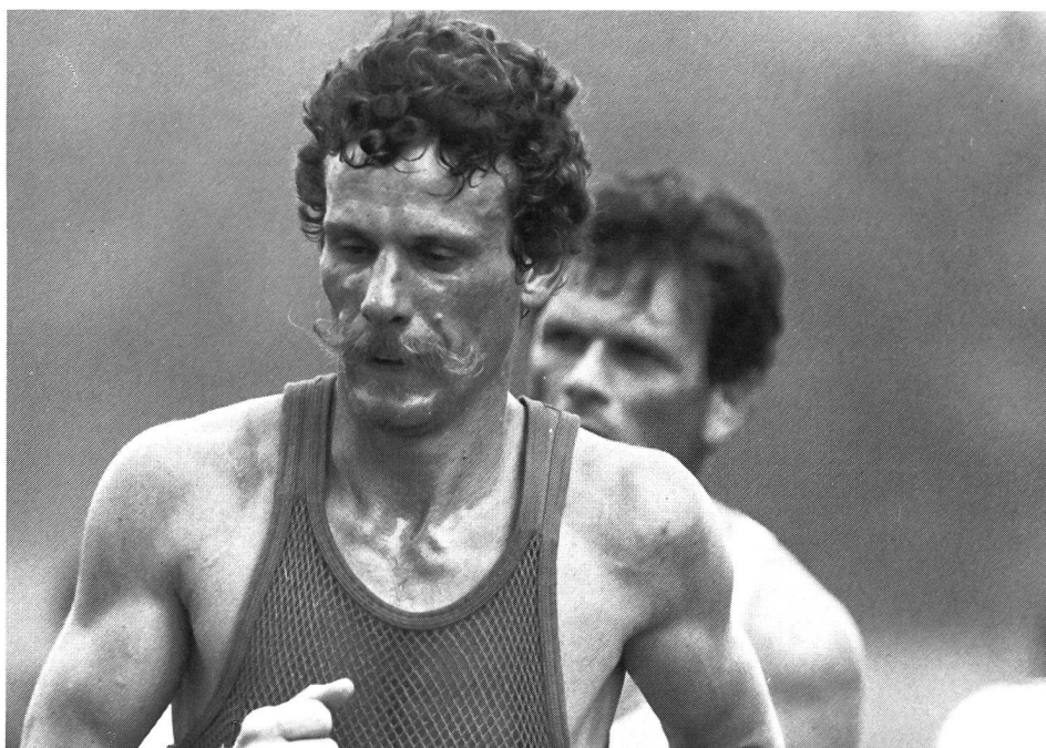
Le regard du marathonien: tourné vers l'intérieur!