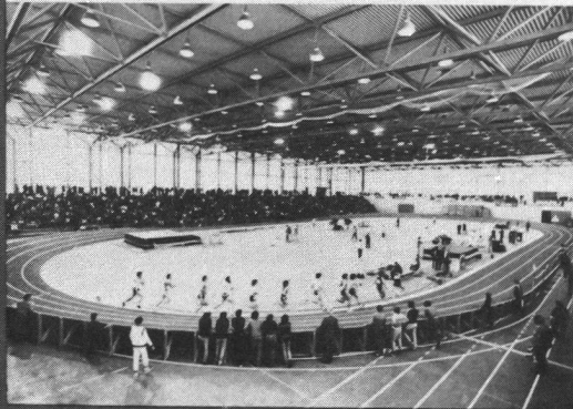
Revue d'éducation physique de l'École fédérale de gymnastique et de sport Macolin (Suisse)