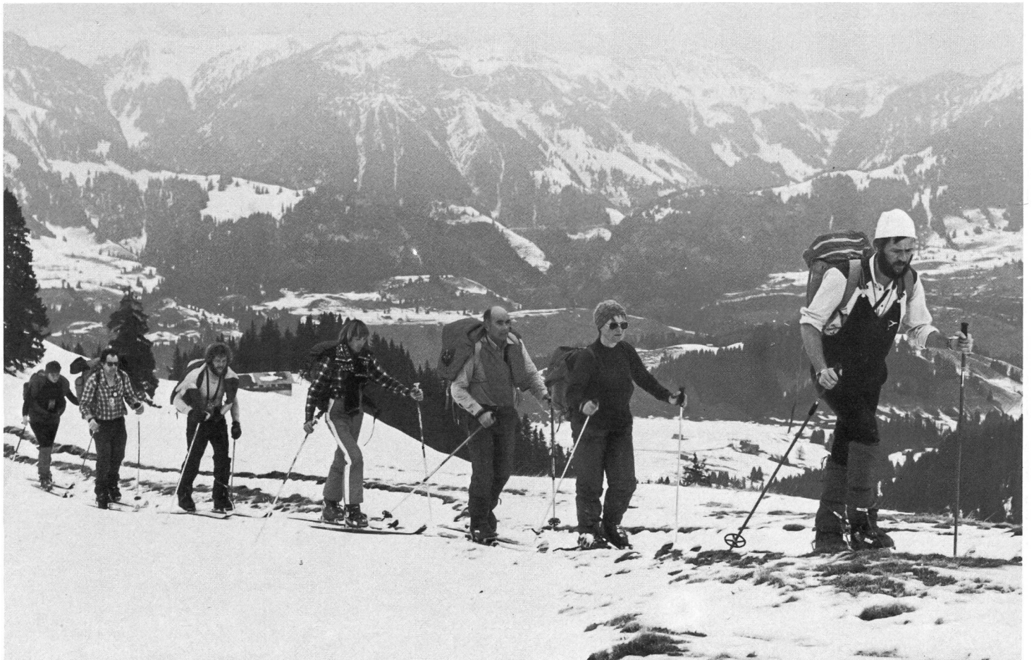
Pour eux aussi, l'hiver a commencé.