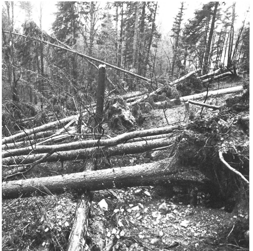
Tout près de l'Institut de recherches.