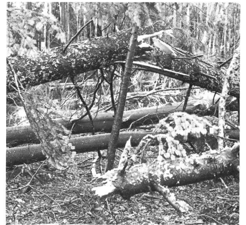
Non loin de la piscine.

Le dernier week-end de novembre, la tempête a déferlé sur le pays, semant la désolation et la tristesse en bien des endroits. Les magnifiques forêts de Macolin n'ont pas été épargnées. Des centaines d'arbres – des sapins surtout – gisent entremêlés sur le sol: ceux-ci cassés comme des allumettes à mi-hauteur, d'autres déracinés. Il faudra longtemps pour tout débarrasser et même, lorsque ce sera fait, d'énormes plaies resteront ouvertes. Heureusement, aucun bâtiment n'a été touché. La piste finlandaise, par contre, est totalement obstruée et inutilisable jusqu'au printemps au moins. (Y.J.) ■