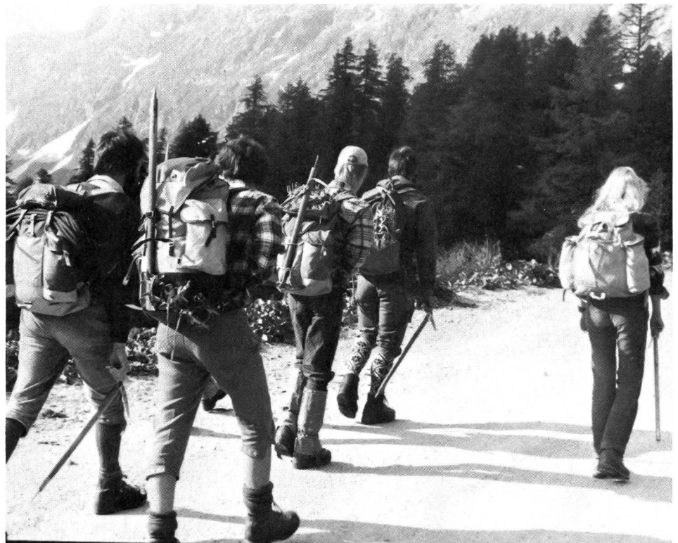
En route vers les sommets, heureux et... bien équipés!