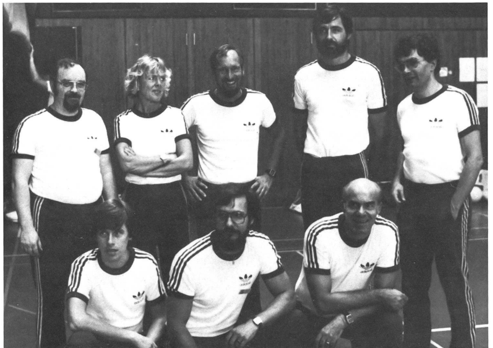
Des organisateurs satisfaits.