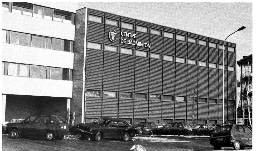
Chemin du Viaduc 12.