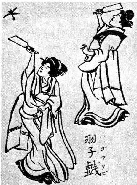
Japonaises jouant au «volant».