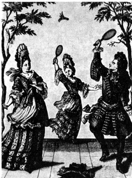
Le «volant» à la cour.