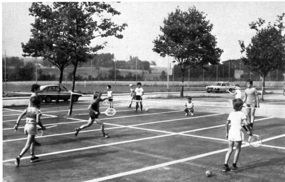
Place de parc: plus de voitures, vive le tennis!

Lorsque l'on maîtrise les coups, on peut se lancer dans la pratique du tennis proprement dit, et, sur ce point, le mini-tennis est la forme qui convient le mieux à l'âge scolaire.