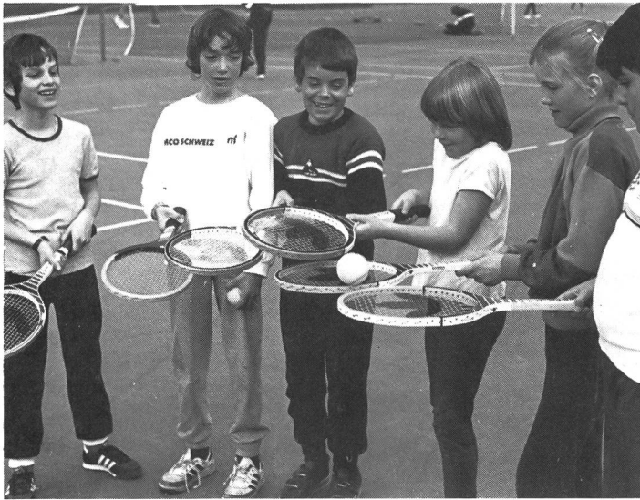
A toi, à moi!